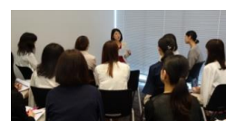
※2017年7月東京開催の様子 (ロールモデルとのラウンドテーブル)